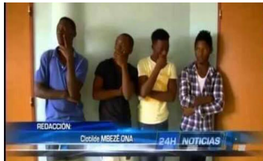
Guinea Ecuatorial: 4 jóvenes detenidos y acusados por ser homosexuales

Las golpizas no terminan en el vecindario. Continúan en las comisarías de Policía. Para liberarse de la violencia, las personas LGTBIQ+ alegan cualquier motivo, normalmente de enajenación mental transitoria, la locura, la posesión