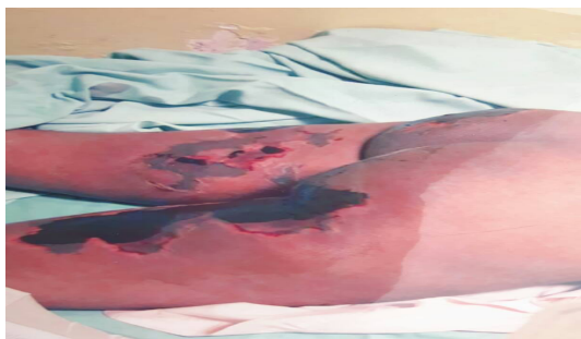
Figura 1.- Fotografía de las lesiones producidas por los torturadores. Se aprecia a simple vista la necrosis tisular fruto de la tortura practicada.

considerada un delito contra “El honor militar”.