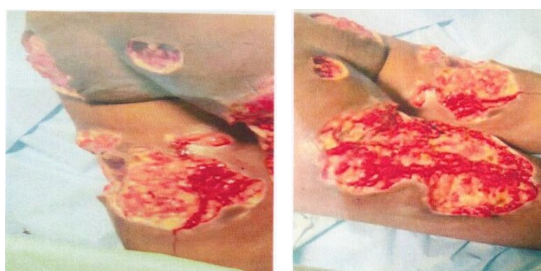
Figuras 2 y 3: fotografías de las lesiones desbridadas quirúrgicamente y producidas por los torturadores.