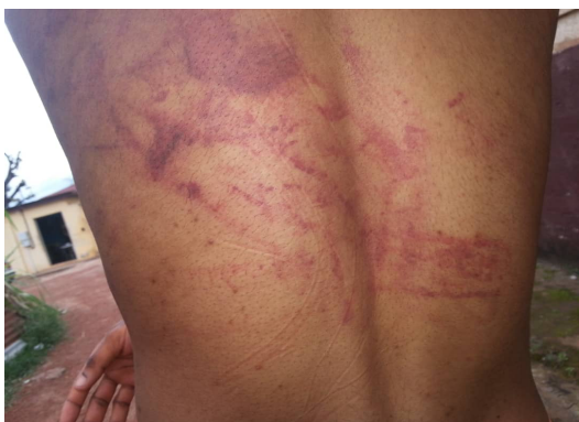
Fotografía: espalda de un menor en la ciudad de Bata tras una paliza de la familia (2019)

La decisión de ser liberadas depende de muchos factores externos a la persona detenida. Las familias, si la víctima ha llegado a las instancias policiales por los y las parientes, pueden solicitar prisión durante días, semanas o meses, como